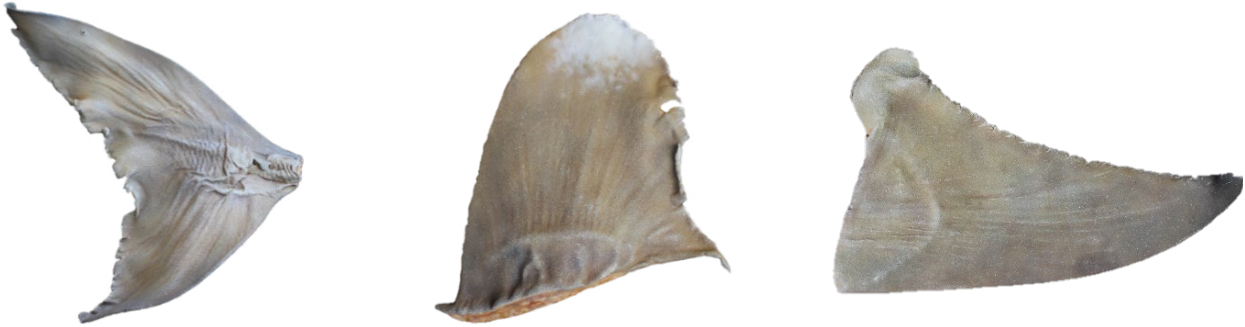
绘制后的鲨鱼鳍复制品(圆犁头鳐-尾鳍、远洋白鳍鲨-背鳍、无沟双髻鲨-胸鳍)

鳍的侧面和底部的成像及绘制过程,以及喷枪颜色和用于完成准确绘制的不同油漆刷,可以点击 这里 下载。