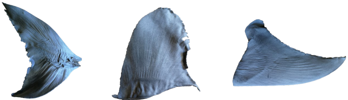
通过尼龙选择性激光烧结工艺, 3D打印后的鲨鱼鳍复制品(圆型头鲨-尾鳍、远洋白鳍鲨-背鳍、无沟双髻鲨-胸鳍)

纸纹理的略显粗糙的表面, 这就与贸易中真实发现的干制鲨鱼鳍很近似了, 还提供了更好的油漆附着力。