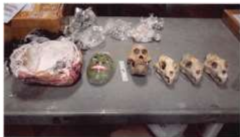
Exhibit 2 - Orangutan and Leopard Skulls found in the March 2021 package