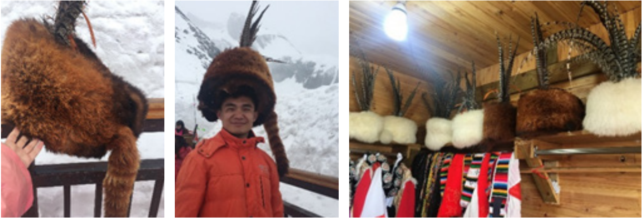
图3.玉龙雪峰顶出售的小熊猫制品

在65家店铺中，仅在一处发现小熊猫制品。这是一家位于云南丽江玉龙雪山顶峰的商店。在供游客佩戴和拍照的地方传统服装里，有几顶小熊猫皮草制成的帽子。每位试戴该帽子拍照的顾客会被收取30元的费用。这些皮草帽子可出售，每顶售价3万元。 商贩称，这些帽子是在三、四十年前获得的，如今已禁止狩猎小熊猫。目前，小熊猫皮制品售价为人民币3.5-4.6万元。