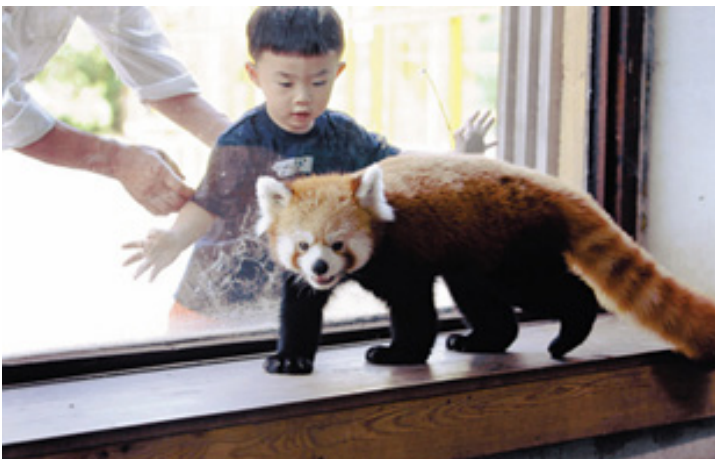
图5. 2015年1月12日，于四川省成都救助的小熊猫