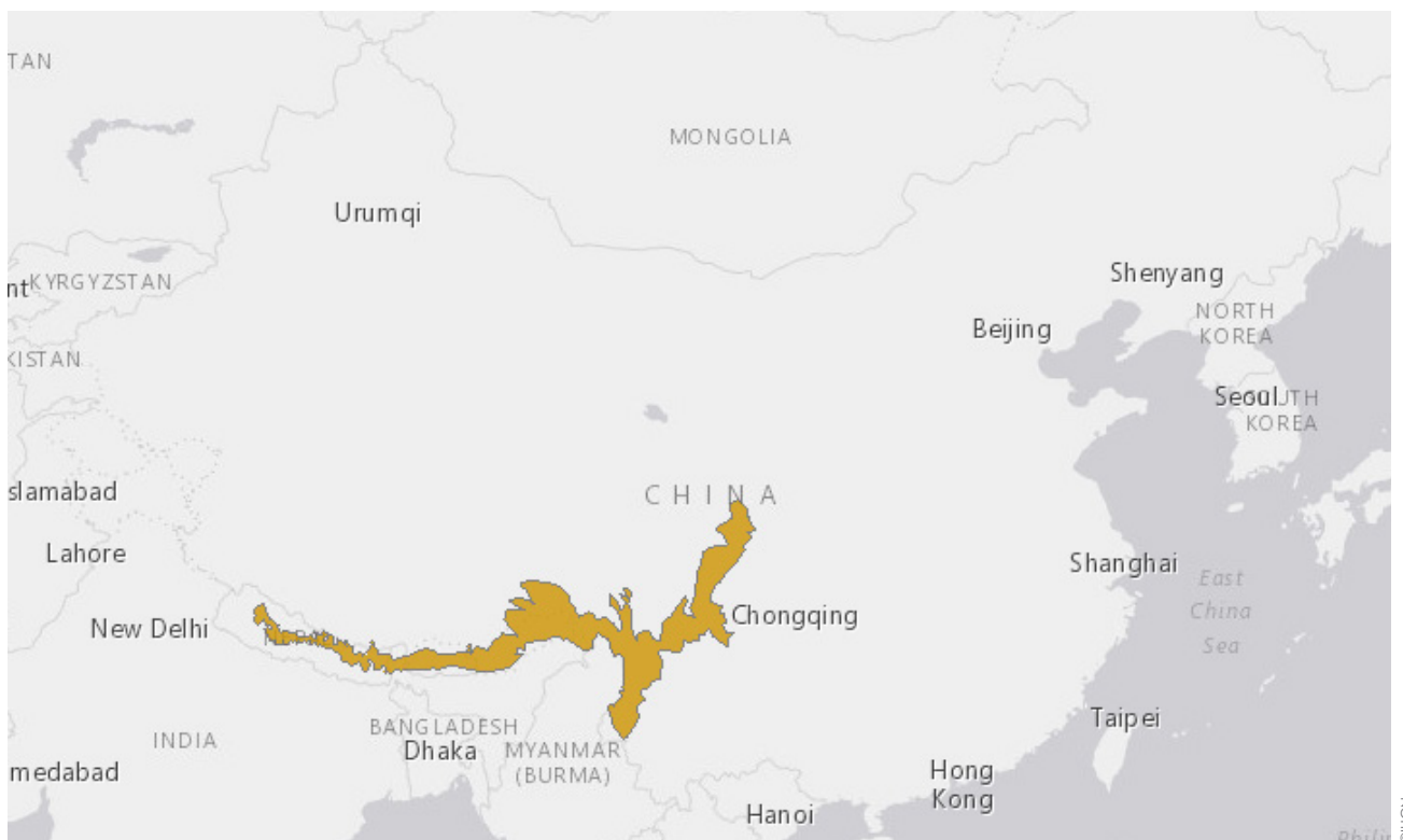
图1. 小熊猫分布

小熊猫 ( Ailurus fulgens ) 是一种原产于喜马拉雅东部和中国西南部的哺乳动物。它有两个亚种：其指名亚种可见于尼泊尔、印度东北部、不丹和缅甸北部的山地森林，东部亚种 ( A. f. styani ) 分布在中国西南地区 (刘旭, 2009)。全球野生种群估计为1.45-1.50万只 (Glatston, 2011)，中国的种群大小约6000-7000只，其中3000-3400只位于四川省；云南省 (1600-2000) 和西藏 (1400-1600) 共占中国种群总数的50%左右 (Glatston et al. , 2015年)。