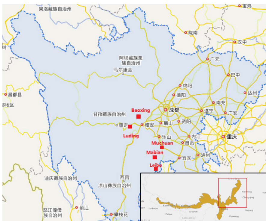
图7.已知的5起涉案小熊猫的来源地