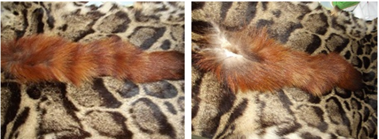
图4.“文玩天下”网站上发布的小熊猫零售广告

另一起事件是“百度贴吧”上的一则帖子：有用户声称其拥有一件由小熊猫皮张制成的服饰，并询问市场售价应为多少。TRAFFIC通过该用户关联的QQ帐户成功联系上了卖家。经过在微信上的讨论，卖家向TRAFFIC发送了一张小熊猫皮服饰的照片，要价7万元。他声称于1988年从云南独龙江获得原料，于1998年加工成衣。南京森林警察学院的专家证实，该制品可能由七块独立的皮张制作而成。该卖家还告诉TRAFFIC，藏族人和蒙古族人喜爱穿戴皮衣。该商贩称，他目前在玉龙雪山工作。该情报已汇报给森林公安，以供进一步调查。TRAFFIC目前尚未收到正式答复。