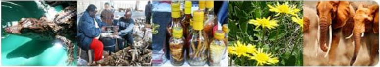
近年来查获超过500枝马达加斯加红木（黄檀木）案例